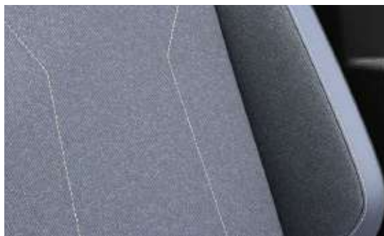
霧藍皮質織布座椅