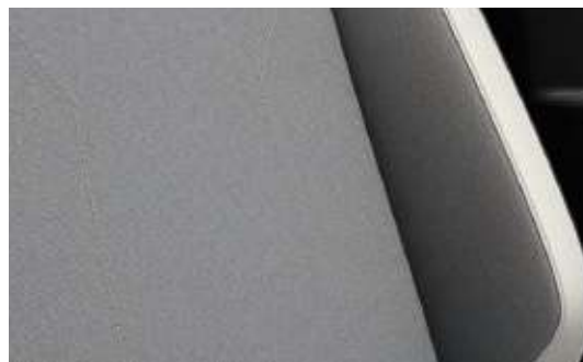
月白灰皮質織布座椅