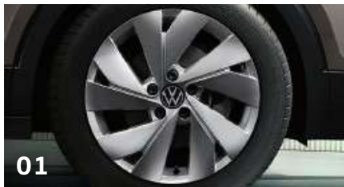
01 16吋 Nottingham 鋁合金輪圈