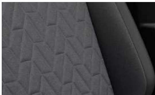
幾何格紋織布座椅