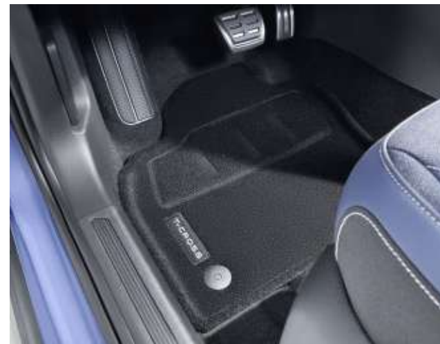
全天候橡膠腳踏墊