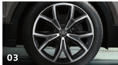
03 18吋 Koeln 鋁合金輪圈 (鎗黑)