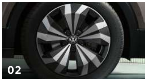
02 17吋 Manila 鋁合金輪圈