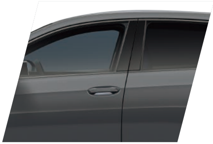
B0A1 夜幕幻影灰 / 黑車頂