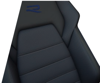
Nappa 真皮電動跑車座椅