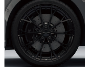
19 吋 Warmenau Black 輕量化鋁圈