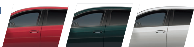
G2A1 暴風紅 / 黑車頂