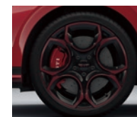
19 吋 Queenstown 五環雙色切削鋁圈 (紅色點綴)