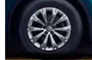
17 吋 Montana 鋁合金輪圈