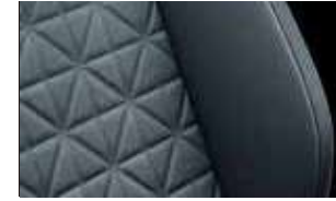
Shooting Star 標準型織布座椅 / 鎢鈦黑