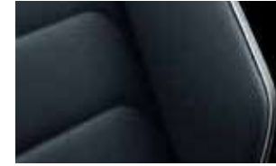
Vienna 運動型真皮座椅 / 鎢鈦黑