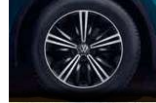
18 吋 Nizza 鋁合金輪圈