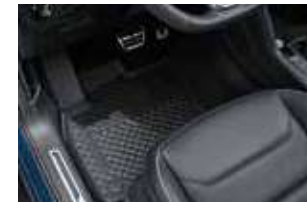
全天候橡膠腳踏墊