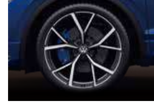
21 吋 Estoril 鋁合金輪圈