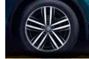
19 吋 Auckland 鋁合金輪圈