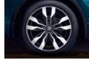
20 吋 Suzuka 鋁合金輪圈