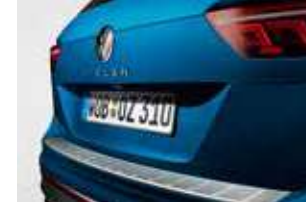
金屬質感後保防護飾板