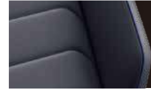
Nappa Carbon 碳纖維紋運動型真皮座椅 / 鎢鈦黑