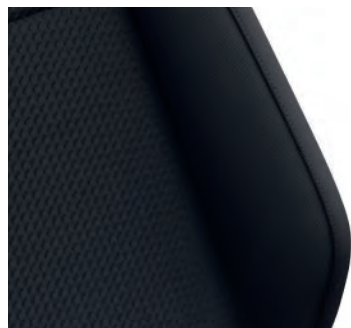
Life / Tech 專屬 Slash 織布座椅