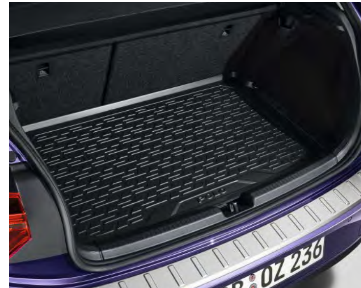
後廂防水墊 (POLO 字樣)