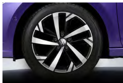
Tech 專屬 16 吋 Torsby