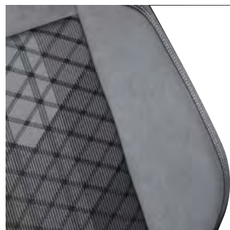
R-Line 專屬 格紋運動化座椅