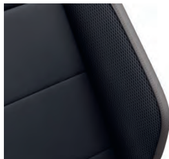
Style 專屬 ArtVelours 皮質 / 類麂皮座椅