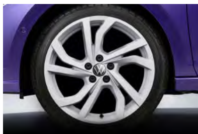
Style 專屬 17 吋 Tortosa