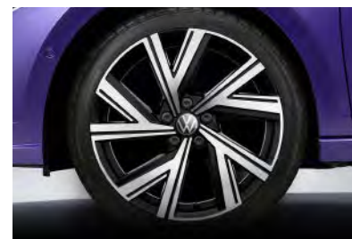
R-Line 專屬 17 吋 Bergamo