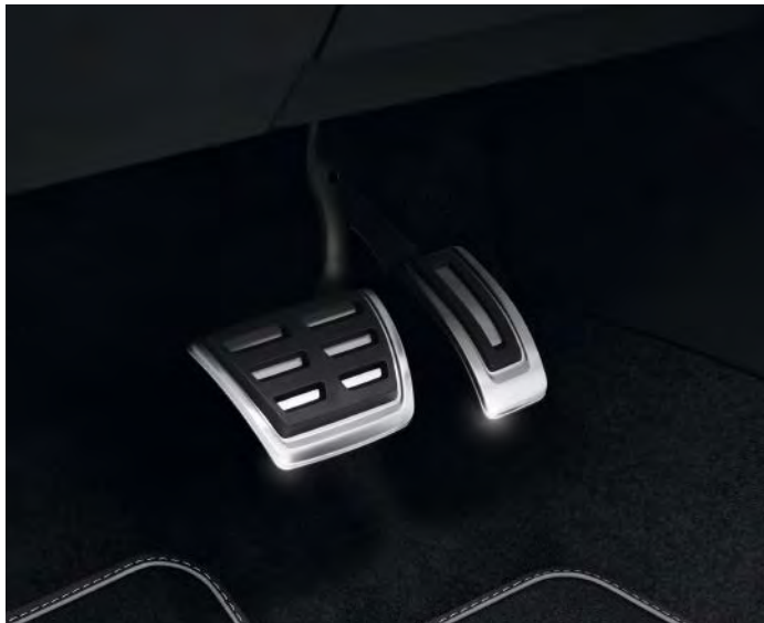
不鏽鋼油門煞車飾版