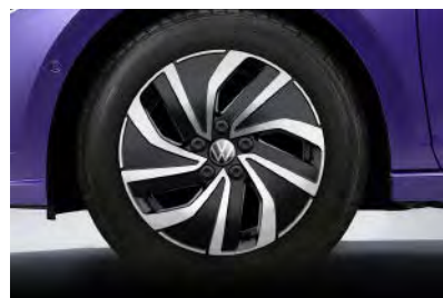
Life 專屬 15 吋 Essex