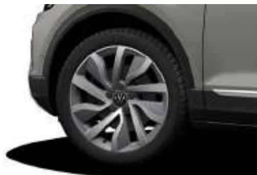
18 吋 Portimao