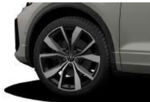
19 吋 Misano