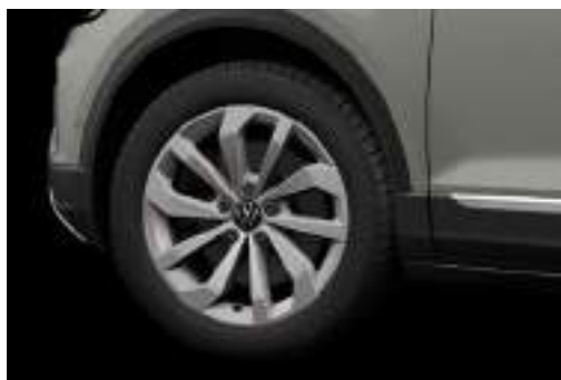
17 吋 Johannesburg