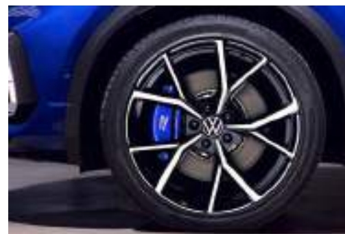
19 吋 Estoril