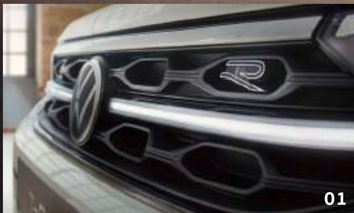
01 水箱護罩專屬銘牌