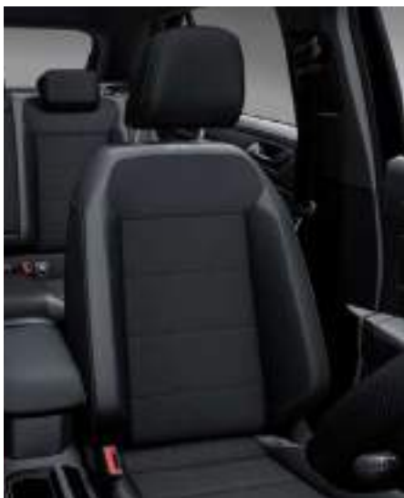
ArtVelours 皮質 / 類麂皮座椅