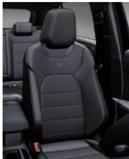
Nappa Carbon 碳纖維紋 運動型真皮座椅